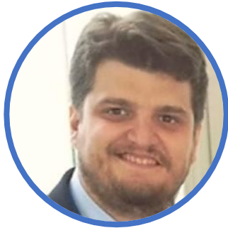
PAST PAOLO FERRUA