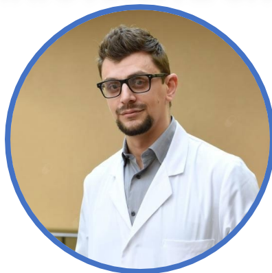
PRESIDENTE BERARDO DI MATTEO